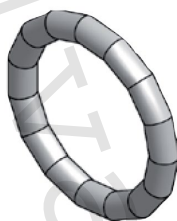
Těsnicí O-kroužek LBP