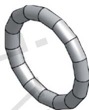
Těsnicí O-kroužek LBP