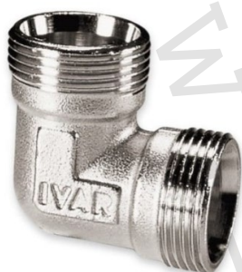
IVAR.RR 4710 N

2) Typ: IVAR.RR 4711 N IVAR.RR 4710 N IVAR.RR 4712 N