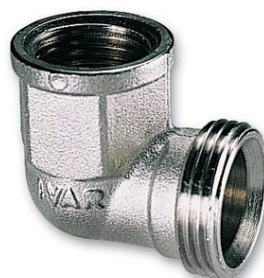
IVAR.RR 4712 N