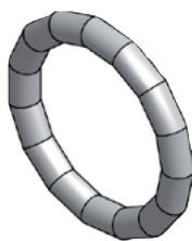
Těsnicí O-kroužek LBP